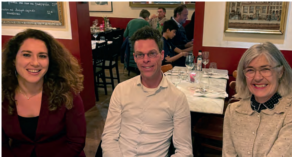
Het bestuur van Gilde Amsterdam.