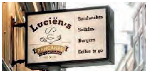
Nieuwe startplaats van Mee in Mokum tijdens de verbouwing van het Amsterdam Museum.