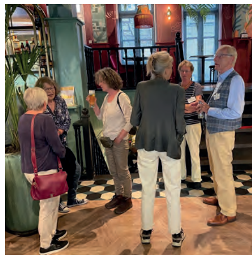
Wat was het een feest om weer offline bij elkaar te zijn op de zomerborrel op 21 juni, de langste dag van het jaar.